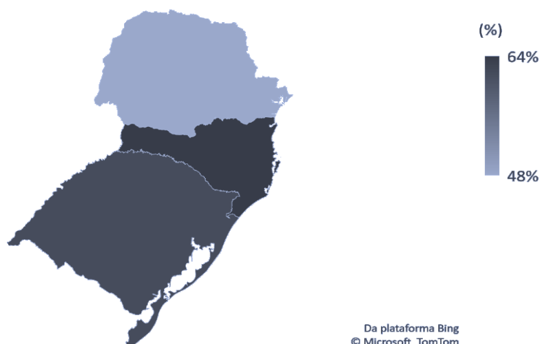
Figura 2. Distribuição das hospitalizações de SRAG por COVID-19 entre os estados do Sul do Brasil

correspondiam a hospitalizações de pessoas que residiam no Sul do Brasil – 83.393 (74,8%) foram classificadas como SRAG por covid-19 (dados não apresentados em tabela). A Figura 2, apresenta a distribuição das taxas de hospitalização de SRAG por covid-19, nesse mesmo período. O Rio Grande do Sul apresenta a maior taxa de hospitalizações de SRAG por covid-19 (85,4%) em relação a todas as hospitalizações por SRAG. Já Santa Catarina apresenta a taxa de 78,5% e Paraná 62,2%.