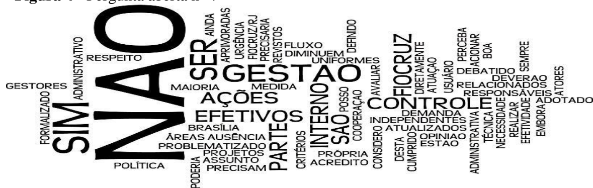
Figura 4 - Pergunta aberta nº 4

Deste modo, é possível entender que pode haver a necessidade de aprimoramento na comunicação das ações de controle direcionadas às cooperações, pois, apesar de haver atos nesse sentido, nem todos os setores afetos têm seu conhecimento.